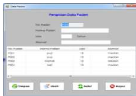
Gambar 1. Form Pasien

Langkah pertama adalah melakukan pengisian data pasien yang akan melakukan konsultasi, sehingga nantinya dapat diketahui riwayat dari pasien tersebut dan memudahkan dalam melakukan pendataan terhadap pasien yang melakukan konsultasi.