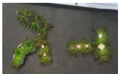
Gambar 4. Hasil uji insektisida pada konsentrasi ekstrak 80%

Deltamethrin adalah pestisida golongan piretroid. Piretroid adalah suatu senyawa organik sintesis yang disintesis dari bunga Krisantemum yang digunakan secara ekstensif sebagai pestisida komersil. Ester keto alkoholik dari senyawa chrysathemic dan asam pyrethric yang bersifat lipofilik bertanggung jawab terhadap sifat insektisida. Piretroid terdiri dari 2 jenis yaitu tipe 1 dan tipe 2. Piretroid tipe 1 adalah memiliki mekanisme aksi mengganggu pencernaan atau lambung serangga serta pernapasan pada serangga sampai menyebabkan kematian. Deltamethrin adalah piretroid tipe 2. Piretroid ini merupakan racun kontak bagi serangga, yang menyerang system saraf serangga dan membunuh dengan cepat. Kematian pada ulat akibat paparan deltamethrin diperkirakan akibat kerusakan ireversibel pada system saraf yang muncul ketika paparan telah terjadi selama beberapa jam [8], [10]