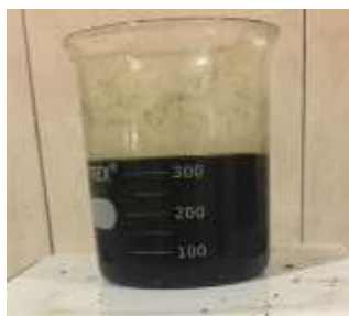
Gambar 1. Crude Ekstrak Daun Lamtoro

Bubuk daun Lamtoro dimaserasi sebanyak tiga kali sehingga didapatkan filtrat sebanyak 5 liter. Filtrat hasil maserasi kemudian di rotary evaporator untuk memisahkan senyawa yang terkandung di dalam daun Lamtoro dengan pelarut etanol sehingga didapatkan crude ekstrak daun Lamtoro sebanyak 300 ml yang berwarna hijau pekat. Setelah itu, crude ekstrak dari hasil rotary evaporator kemudian di hotplate untuk menguapkan pelarut yang masih ada dari hasil rotary evaporator . Hasil ekstraksi bubuk daun Lamtoro ditunjukkan pada gambar 1.