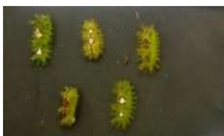
Gambar 3. Uji insektisida dengan Deltamethrin

Pada pengujian insektisida, hama ulat api ( Setothosea asigna v. Eecke) yang berada di tanaman kelapa sawit sebanyak 5 ekor setiap ulangan pada instar 2 sampai instar 5 disemprot menggunakan insektisida kimia “ Deltamethrin , setelah disemprot hama ulat api masih aktif bergerak, namun dalam waktu 9 menit setelah penyemprotan pergerakan ulat mulai melambat dan berhenti beraktivitas. Ulat mulai berjatuh pada waktu 13 menit, ulat mati seluruhnya pada waktu sekitar 28 menit 14 detik. Ulat mati dengan badan kaku dan keras, perut menggelembung, dan kulit mengerut. Foto ulat yang diperlakukan dengan deltamethrin ditunjukkan pada gambar 3.