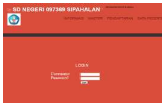
Gambar 3. Lay Out Login Admin

Pada lay out login Admin , Admin diminta untuk memasukkan username dan password yang telah tersimpan di database . Lay out login admin berfungsi untuk keamanan dari program ini agar admin yang tidak dikenal dan belum terdaftar serta tidak mempunyai hak akses atas aplikasi ini tidak dapat menggunakannya. Tampilan lay out Login Admin dapat dilihat seperti gambar 3 dibawah ini: