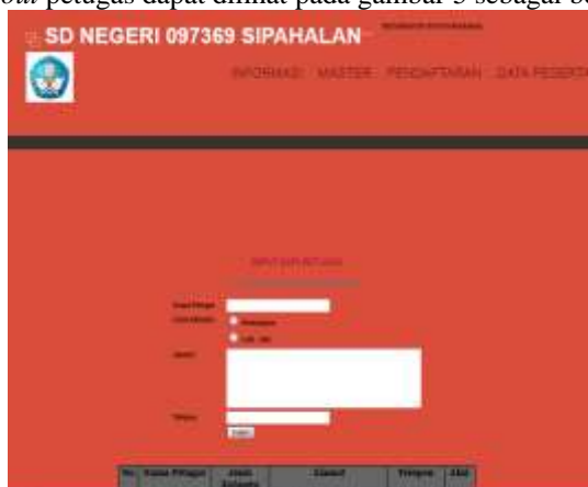
Gambar 5. Lay Out Petugas

Lay Out Petugas digunakan untuk mengolah data Petugas. Lay Out Petugas hanya dapat di tambah, di hapus, dan di ubah oleh Admin. Tampilan lay out petugas dapat dilihat pada gambar 5 sebagai berikut ini: