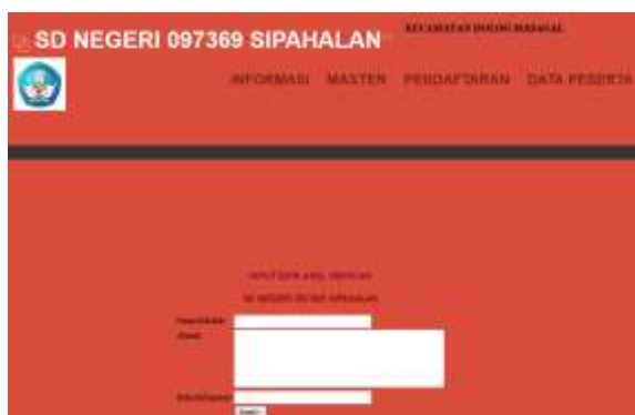
Gambar 7. Lay out Asal Sekolah

Lay out Asal Sekolah digunakan untuk mengolah data Asal Sekolah. Lay out Asal Sekolah hanya dapat di tambah, di hapus, dan di ubah oleh Admin. Tampilan lay out Asal Sekolah dapat dilihat pada gambar 7 berikut ini :