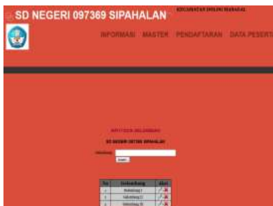
Gambar 6. Lay Out Gelombang

Lay out gelombang digunakan untuk mengolah data gelombang. Lay out jenis kapasitas hanya dapat di tambah, di hapus, dan di ubah oleh Admin. Tampilan Lay Out gelombang dapat dilihat pada gambar 6 sebagai berikut :