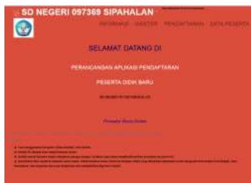
Gambar 4. Lay Out Home

Lay Out Home merupakan halaman yang berisikan menu-menu yaitu informasi, admin/login, master (gelombang, asal sekolah, petugas), peserta dan laporan. Tampilan lay out Home dapat dilihat seperti gambar 4 dibawah ini: