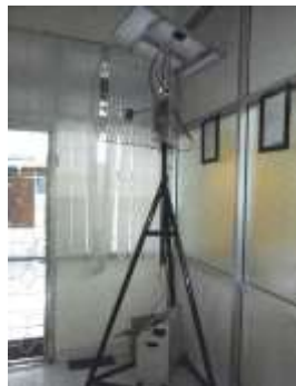
Gambar 1. Prototype Public Monitoring System

Public Monitoring System adalah perangkat yang sudah dikembangkan pada penelitiannya sebelumnya. Perangkat ini mengintegrasikan Raspberry PI, Kamera, Access Point dan Solar Cell. Tujuan dari pengembangan alat ini adalah memberikan inovasi perangkat monitoring yang tidak terikat dengan sumber listrik. Alat ini terdiri dari tiang Solar Cell yang dibagian tengah ditanamkan Raspberry PI dan Kamera, serta dibagian bawah terdapat Accu sebagai catu daya utama. Keunggulan perangkat ini adalah mobilitasnya yang tinggi karena dapat diletakkan dimana saja untuk melakukan kegiatan monitoring. Adapun cara kerja alat dimulai dari proses pengisian accu oleh solar cells, kemudian daya listrik yang dihasilkan diteruskan untuk menghidupkan perangkat IP camera, Raspberry Pi dan modem. Proses tersebut dilanjutkan dengan penangkapan image di lokasi oleh IP camera, kemudian IP Camera akan mengirimkan data tersebut melewati router dan modem. Data akan dikirimkan melalui internet ke server utama Public Monitoring System [8].