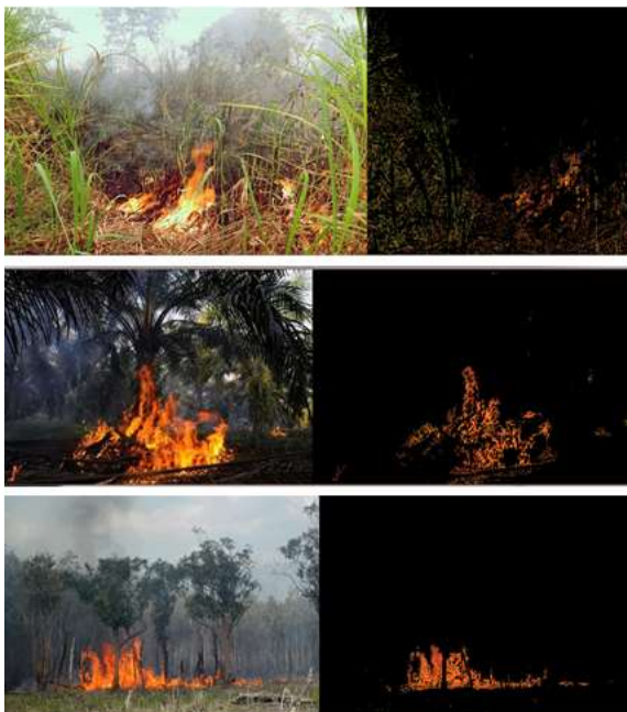
Gambar 4. deteksi warna untuk mencari titik api

Adapun hasil pengujian deteksi warna diimplementasikan pada 2 kasus yaitu pengujian deteksi warna orange merah untuk implementasi deteksi warna api dan deteksi warna coklat untuk deteksi penyerangan hama wereng pada area persawahan. Ouput pengujian tersaji dalam gambar 4 dan 5.