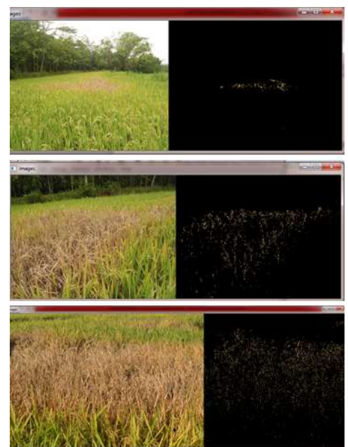
Gambar 5. deteksi warna untuk mencari titik hama wereng