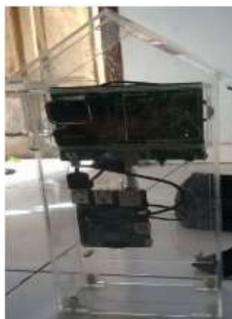
Gambar 2. Bagian Penangkap Gambar Public Monitoring System

Dalam tahap ini kamera menangkap gambar yang ada di depan kamera, adapun pengambilan gambar disetting dalam rentang waktu tertentu. Hal ini dimaksudkan agar tidak membebani storage (SD Card Internal) dalam penyimpanan data[9].